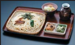
山菜付ざるうどん